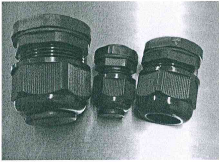
紫外线直射产品试验后照片