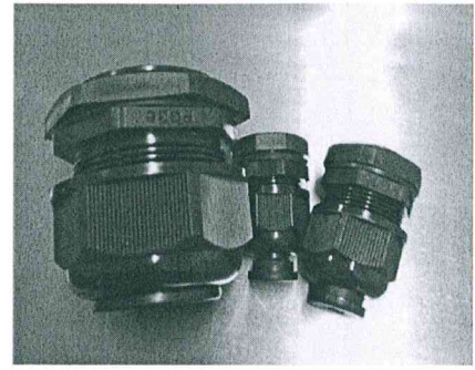
避光产品试验后照片